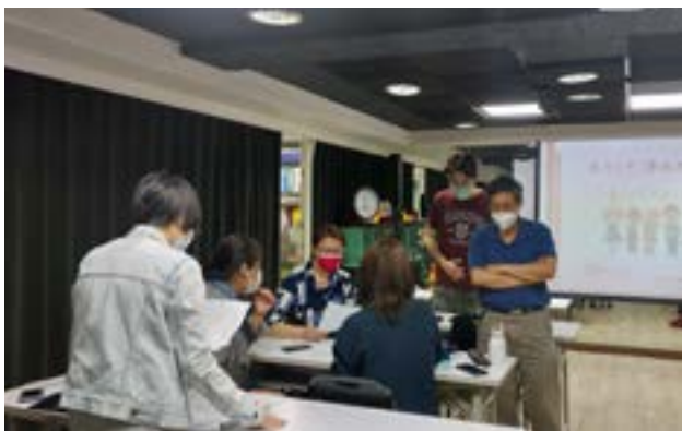
少兒阿卡師資培訓工作坊 - 上課補影