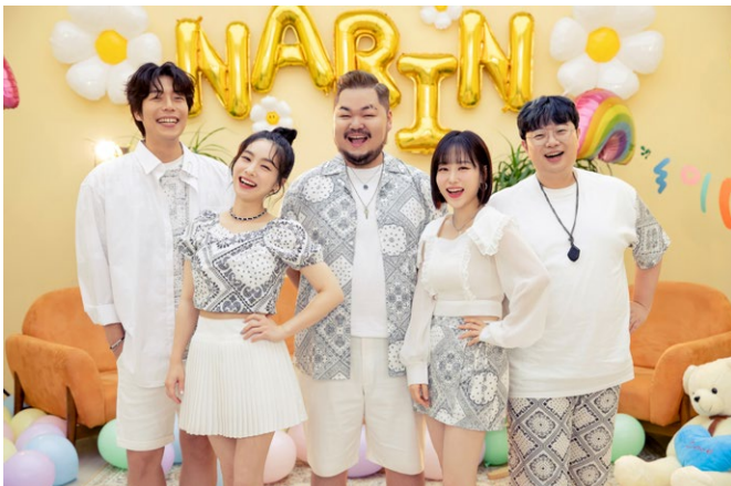
韓國 Narin 人聲樂團

繽紛四月天，現代阿卡貝拉在春天唱出生命的新樂章！台灣合唱音樂中心「2024 春唱」將於 4 月 19 日熱烈展開 – 今年的春唱，我們特別邀請來自韓國充滿動力與熱情的『Narin 人聲樂團』於台北市中油國光廳舉辦專場音樂會與全國巡演走透透。另外於台北地下街 12 號廣場的 30 隊國內人聲樂團超級人聲嘉年華的不斷電趴趴唱，唱出 2024 動感阿卡！