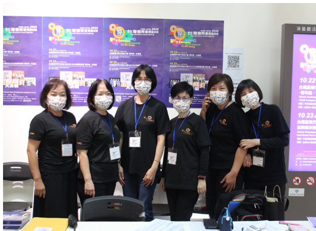
台灣盃現代阿卡貝拉大賽 - 義工