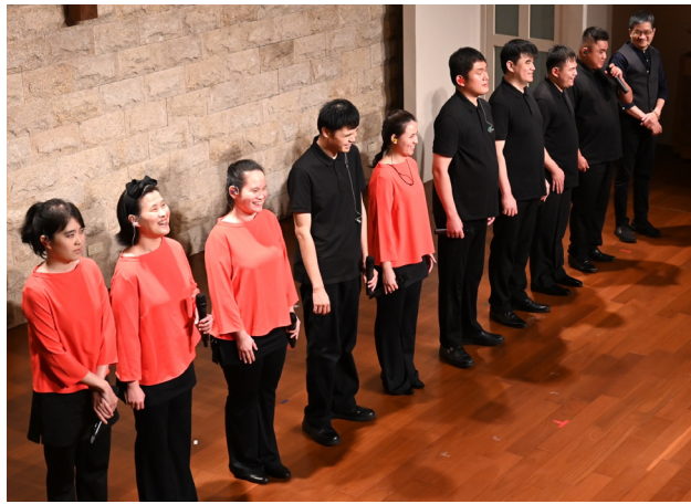
《蝦米視障~藝 FUN》全體合照