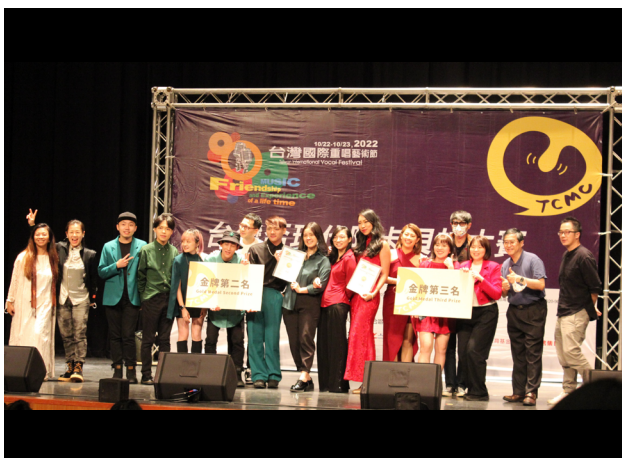
金牌總決賽 - 社會組金牌前三名大合照