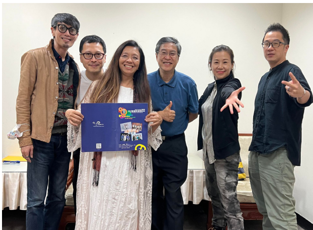
金牌總決賽 - 評審合照