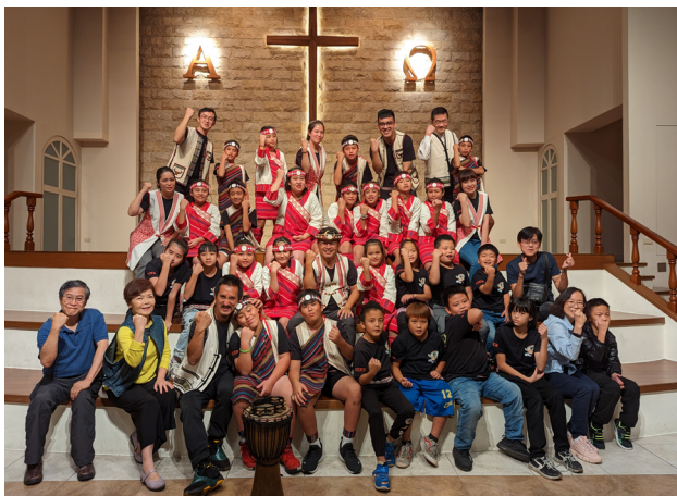
《泰雅孩子 FUN 聲唱》全體合照