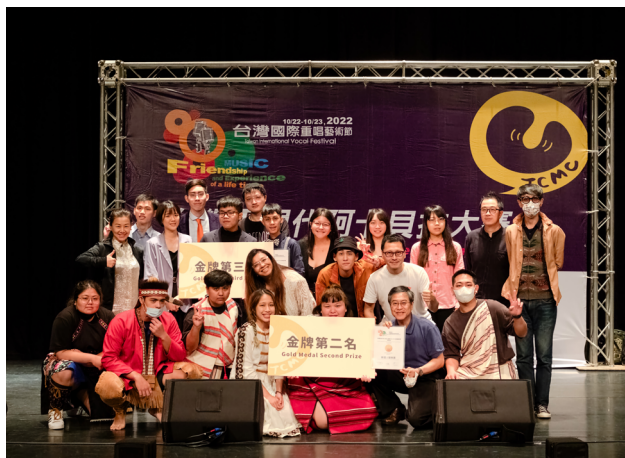
金牌總決賽 - 青年組金牌前三名大合照