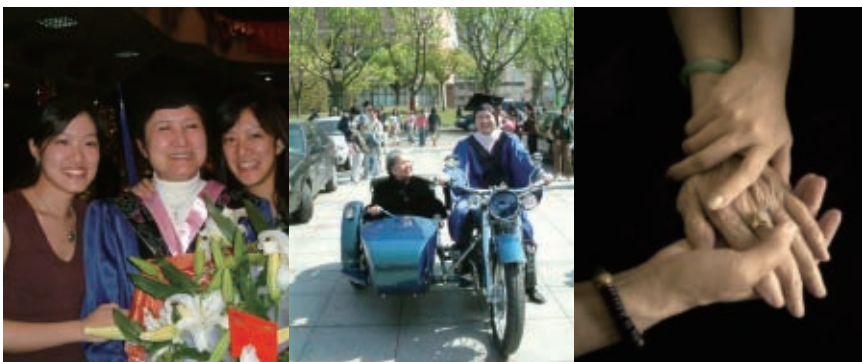
重要活動，有家人的參與是件多麼幸福的事啊！ 55歲獲得上海交大碩士學位，騎上手工打造的酷車，載96歲母親繞校園3圈並獻上優秀學員榮譽。 三代的手緊緊握在一起。