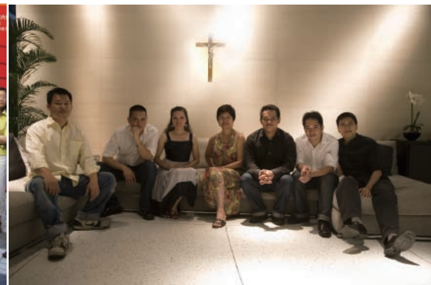
安排歐開合唱團，跨海演出，轟動上海。