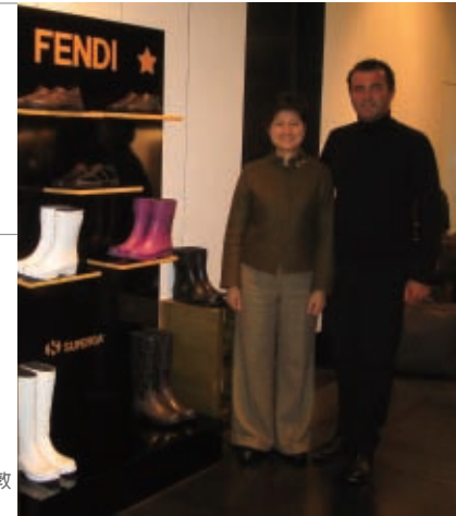
喜見自己的產品陳列在倫敦Fendi店內，趕快照張相