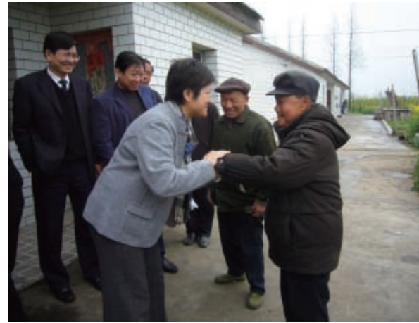
喜見抗日英雄於麻瘋村